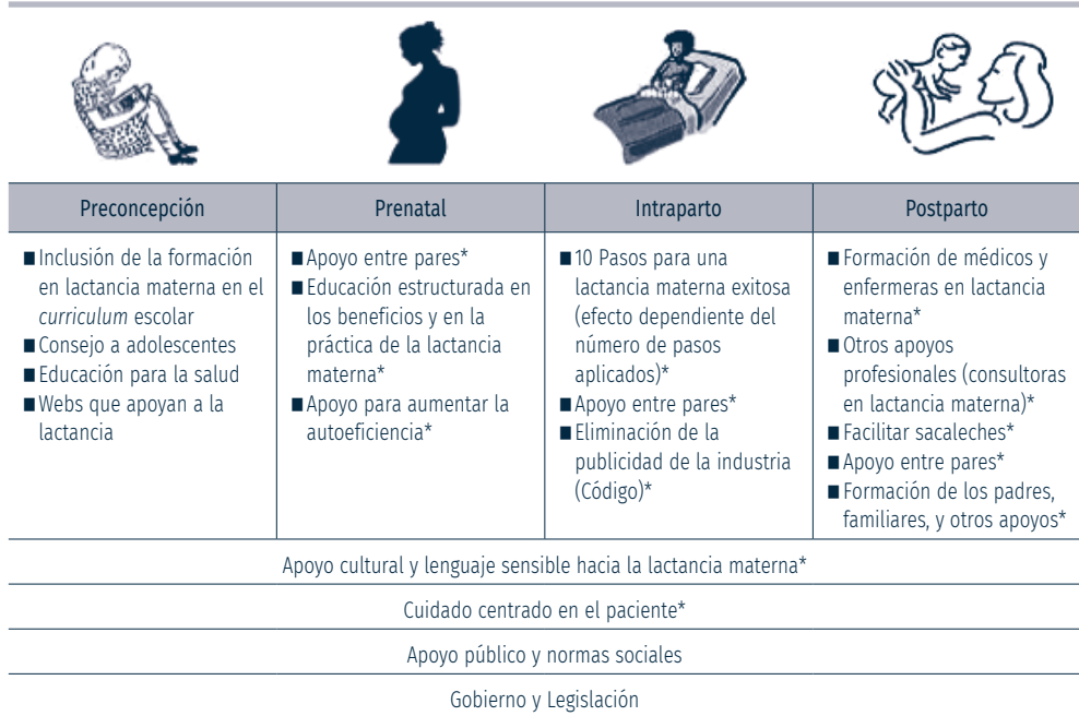
Figura 2. Esquema de los momentos en los que se pueden realizar intervenciones, la mayoría basadas en pruebas, para apoyar la lactancia materna 29

* Evidencia disponible para apoyar la acción.