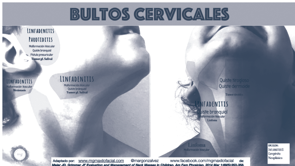
Figura 3. Bultos cervicales según su localización

En las malformaciones derivadas del 1.º arco (casi el 10%), el quiste o la fístula se encuentra en el triángulo formado por el hioides, mentón y el trago y por delante del esternocleidomastoideo.