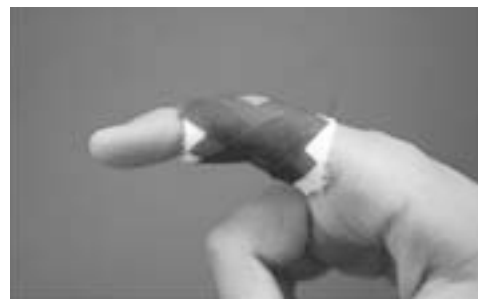
Figura 3. Vendaje funcional del esguince de los colaterales de los dedos