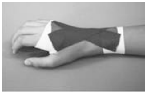
Figura 2. Vendaje funcional del esguince de muñeca

El paciente presenta dolor; inflamación local y en la exploración se podrá objetivar inestabilidad al forzar el varo o el valgo, dependiendo del ligamento lesionado.