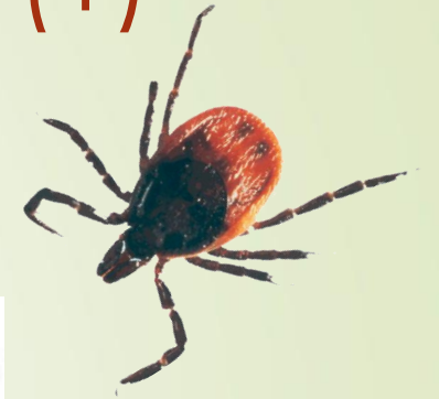
Clasificación clínica de la enfermedad de Lyme