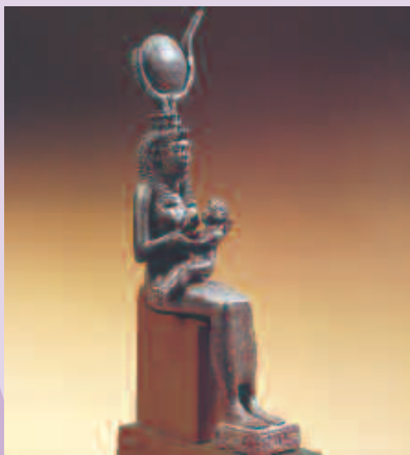
Figura 4 Estatua de Isis amamantando a Horus. Época tardía. Museo del Cairo.