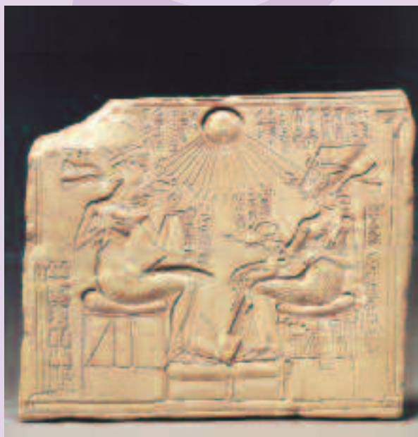
Figura 1 Ajenatón y Nefertiti juegan con sus hijas. Estela de un altar. Tell-el-Amarna, Imperio Nuevo, XVIII Dinastía. Museo Egipcio de Berlín.

En la medicina egipcia mezclan conceptos mágico-religiosos con teorías médicas basadas en la observación y el estudio. Describen tratamientos médicos hechos a base de plantas, minerales y productos animales.