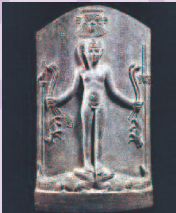
Figura 3 Cipo de Horus sobre cocodrilo. Periodo Ptolomaico. Museo del Cairo.