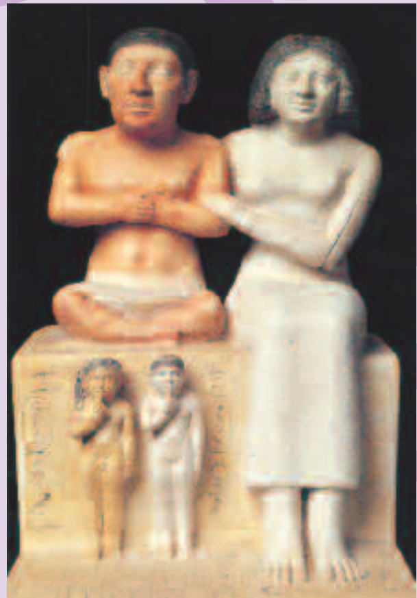
Figura 5 Grupo escultórico del enano Seneb y su familia. Finales de la V Dinastía, inicio de la VI. Museo del Cairo.