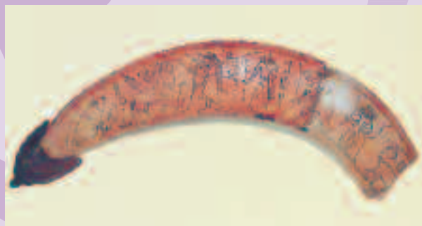
Figura 2 Marfil mágico. Imperio Medio, Dinastía XIII. Museo del Cairo.

En el Reino Medio y en el Segundo Periodo Intermedio, un objeto asociado a madres y niños era un colmillo de hipopótamo seccionado por la mitad a lo largo, de modo que quedaba un lado plano y el otro convexo; se decoraba un lado o los dos con figuras de animales fantásticos, demonios protectores y símbolos apotropaicos 1 , figura 2.