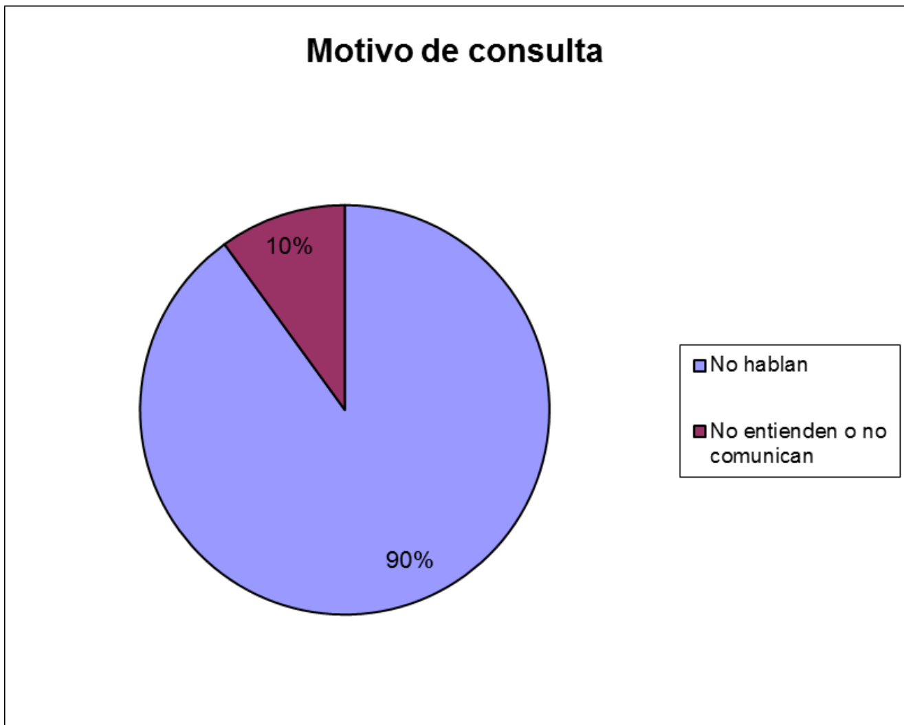
Figura 2. Motivo de consulta.