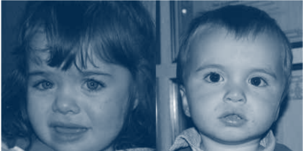
Figura 4. Pseudoestrabismo. Ambos pacientes tienen el reflejo corneal centrado en las pupilas (test de Hirschberg normal), indicador de que ambos ojos están fijando (ausencia de estrabismo). La paciente de la izquierda impresiona de endotropía por un epicanto que tapa la esclera nasal del ojo derecho. En el paciente de la izquierda sucede lo mismo con el ojo izquierdo

Este es un test rápido, útil para niños de 1 año o mayores, más sensible que el Brückner y que además permite descartar pseudoestrabismo (Fig. 4) que puede aparecer por posiciones anómalas de los párpados (epicanto, que simula estrabismo convergente al tapar parte de la porción escleral nasal a la córnea) o de las órbitas (hipertelorismo, que simula estrabismo divergente por incremento de la distancia entre ambos ojos). El test de Hirschberg mostrará un reflejo corneal centrado en ambas pupilas y no como en los estrabismos verdaderos.