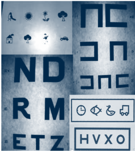
Figura 2. Optotipos de exploración de agudeza visual

ba"... y tienen la limitación de que se puede acertar al azar en un 25% de los casos, pues en general solo incluyen cuatro posibles orientaciones. Son útiles en niños de tres o cuatro años y en aquellos más tímidos, o con menor desarrollo cognitivo y que, aun siendo mayores, no conozcan letras o números.