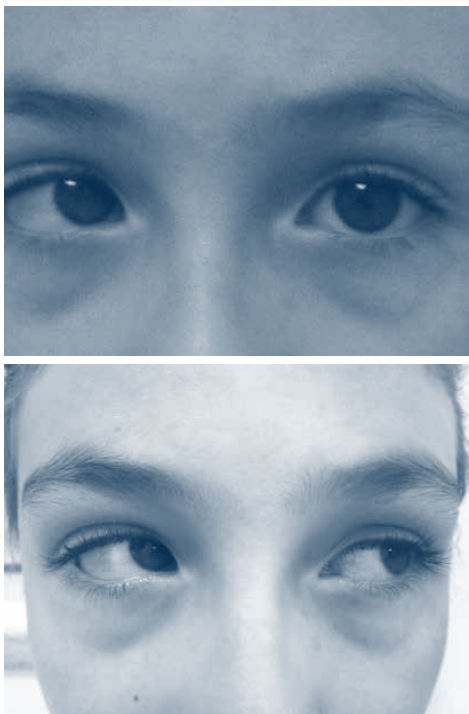
Figura 5. En la primera imagen se aprecia endotropía: el ojo izquierdo fija la mirada mientras que el derecho está desviado en convergencia. En la segunda imagen sea aprecia un estrabismo vertical por hiperfunción de músculo oblicuo inferior del ojo derecho: en la levoversión (mirada a izquierda), al aducir el ojo derecho este se eleva (hipertropía)

ojo y el tratamiento es intervencionista (bien con toxina botulínica por debajo de los tres años o bien con cirugía por encima de los dos). Presentan recidivas tardías frecuentemente y asocian grados importantes de ambliopía.