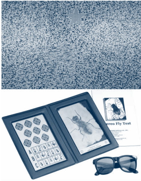
Figura 3. Test de estereopsis

Existen dos tipos de test de estereopsis (Fig. 3): los que precisan para realizarlos de unas gafas (bien polarizadas, bien con color rojo en un ojo y verde en el otro) como el TNO o el Titmus test; y los que se hacen a ojo descubierto como el Lang estereotest. Los primeros dan mayor sensibilidad diagnóstica, pero son más rechazados por los niños pequeños por tener que ponerse las gafas y son algo más complejos de utilizar. Los segundos son algo menos precisos pero son muy rápidos de utilizar y muy aceptados por todos los pacientes, pudiendo usarlo incluso en niños de dos años. Son probablemente estos segundos los más aconsejables para un cribado rápido y universal en una consulta de Pediatría.