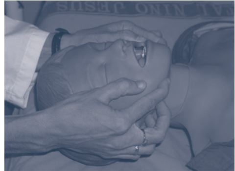
Figura 4. Inmovilización cervical con collarín e inmovilizadores laterales